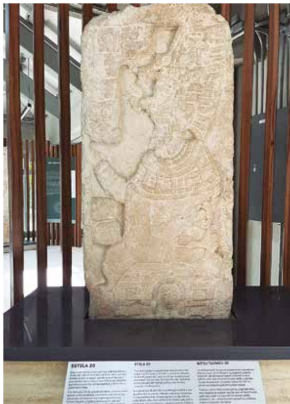
La Estela 20 que se exhibe en el nuevo Museo de sitio de la zona arqueológica de Edzná muestra a Ixb'aaah Pahk, la gobernante maya que obtuvo el rango de Kaloomté.

Además, está el Edificio de los Cinco Pisos, cuya construcción data durante el florecimiento de Edzná. Varios escalones de ese majestuoso edificio tienen 84 jeroglíficos que originalmente