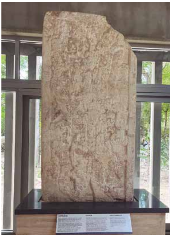
Estela 22 que retrata a Kai Chaak, el más poderoso gobernante de Edzná, representado de pie con un gran tocado.