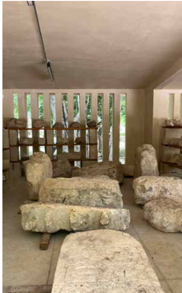
Estelas, piedras labradas y partes de monumentos hallados recientemente en Edzná.

Las autoridades del INAH esperan que el nuevo museo de la zona arqueológica de Edzná atraiga a más visitantes locales, nacionales y extranjeros.