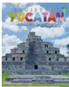
En Portada: Edzná, Camp.